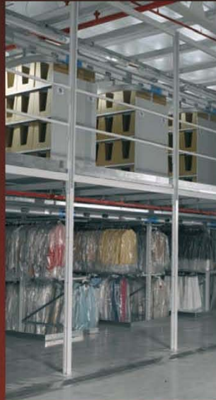
Carga ligera y textil