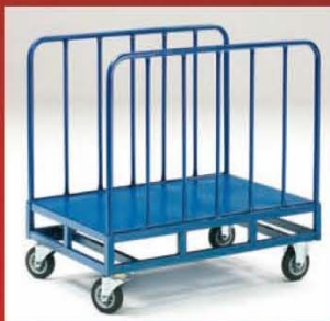
Carro dos barandas frontales