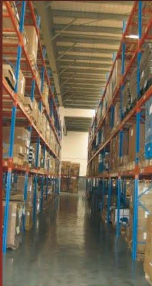
Estanterías de paletización