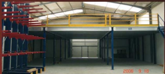
Altijos y cantilever