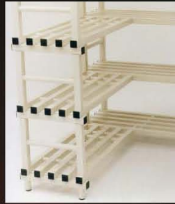
Estantería de resinas plásticas