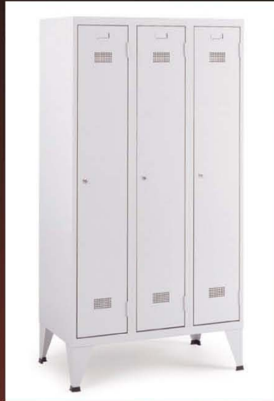
Amplia gama de taquillas para vestuarios